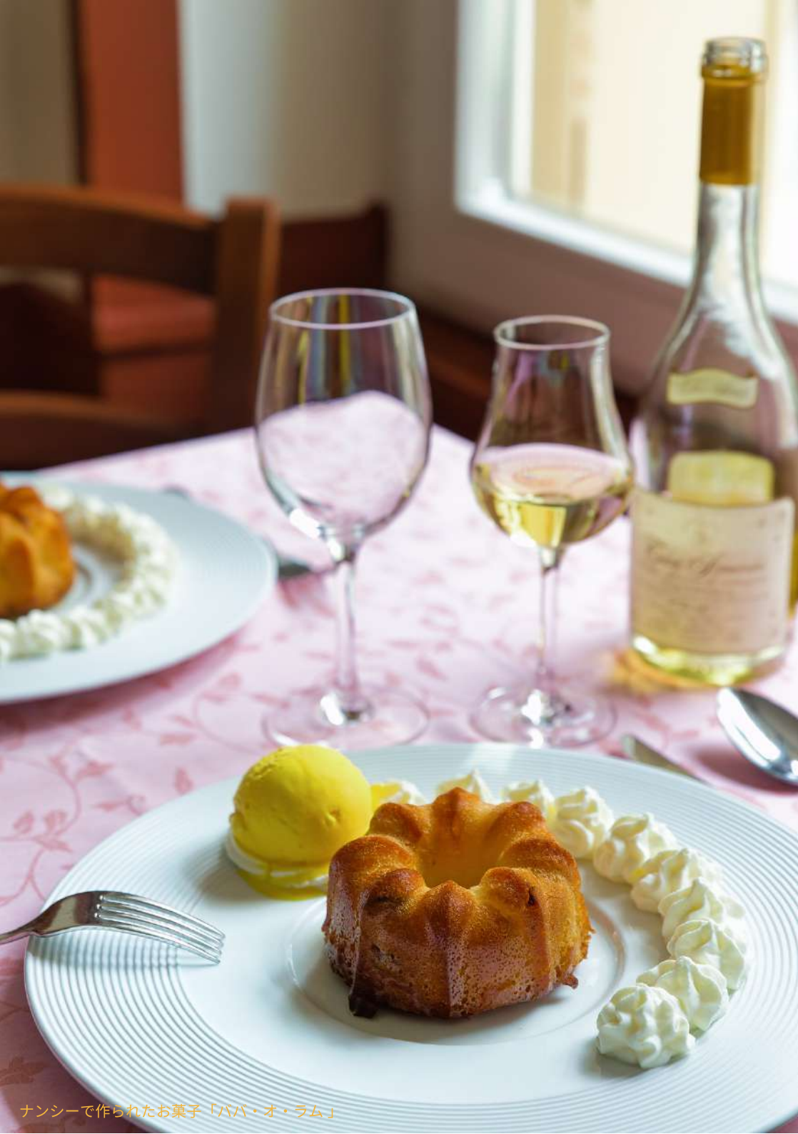
ナンシーで作られたお菓子「ババ・オ・ラム」